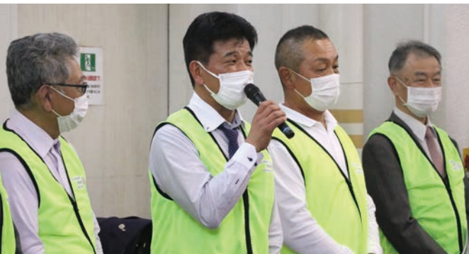
交流事業閉会式 松浦会長挨拶