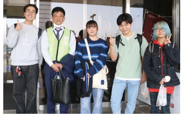
参加した名古屋芸術大学 ローターアクトクラブの皆さん