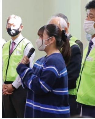
名芸大ローターアクトクラブ 勝山会長 挨拶