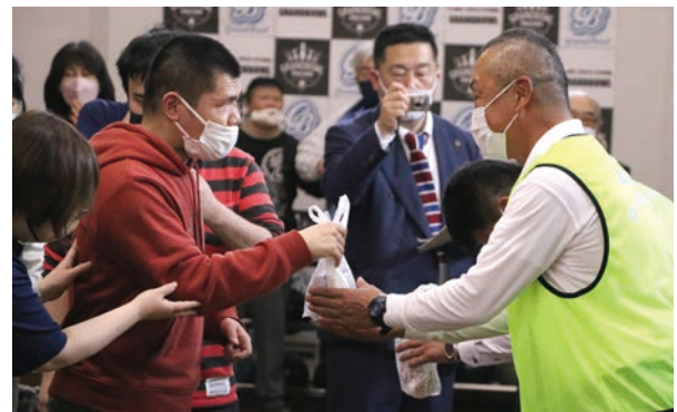
施設の皆さんからのお礼

皆様改めまして、こんにちは。ボウリング大会、お疲れ様でした。また本日は西春ひまわり作業所、セルフ師勝の皆様、ようこそお越しください、ありがとうございました。久しぶりのボウリング大会でございましたが、喜んでいただけましたでしょうか？コロナ禍という事で、長らく交流イベントができませんでしたが、今後も両施設の皆さんに楽しんでいただける企画を立てますので、次回も沢山の皆様に参加していただきたいと思っております。本日は短い時間帯でございましたが、有意義で楽しい時間を過ごすことができました。この後、両施設へ記念品目録を贈呈させていただきます。