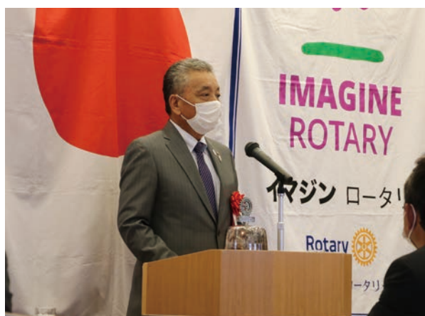
松岡ガバナー補佐からご挨拶をいただきました