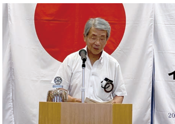
社会奉仕委員会 安田副委員長