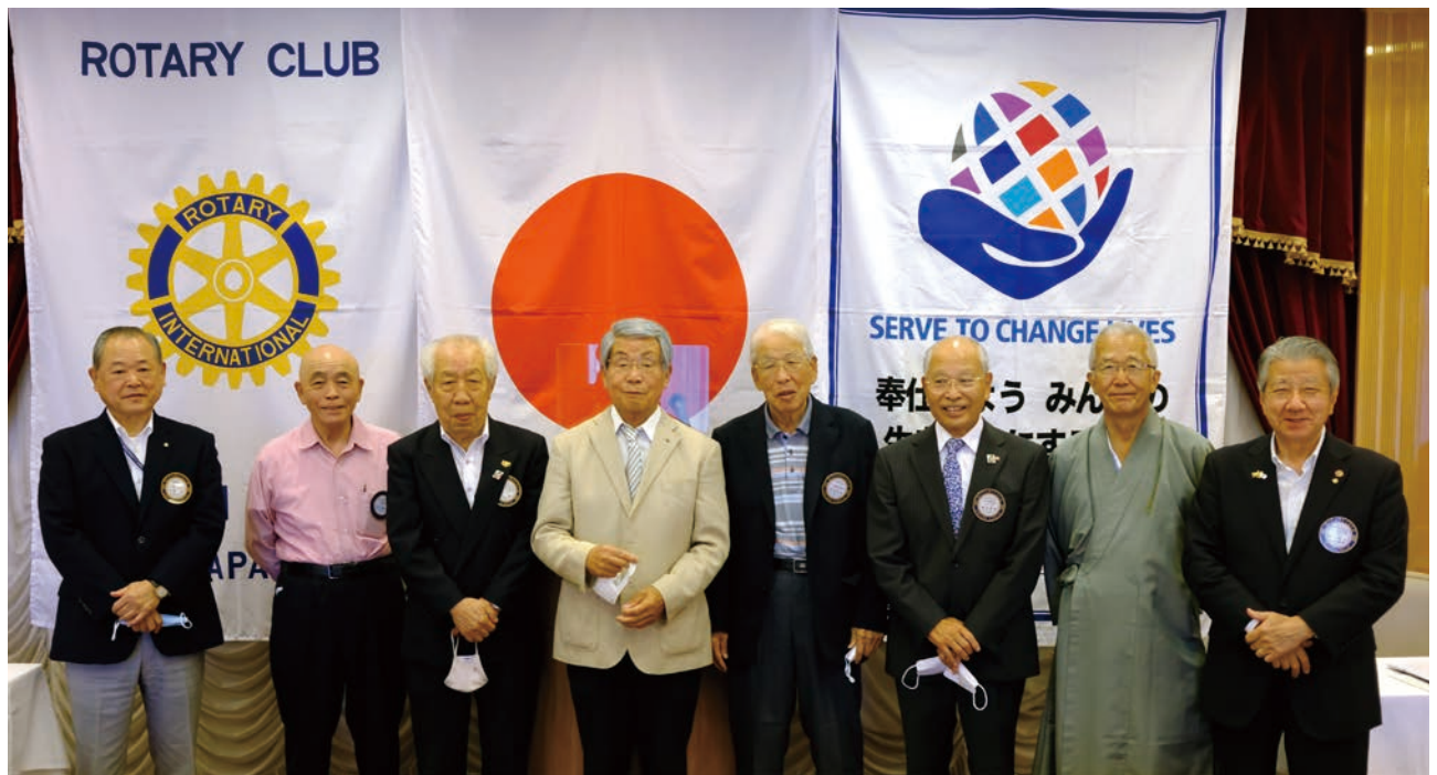
古希・喜寿・傘寿のお祝い