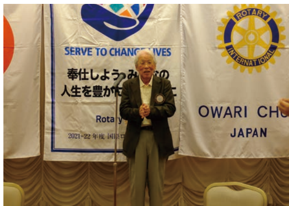
中締め 赤堀パスト会長