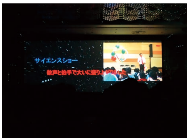
写真は尾張中央RC「障害者支援交流事業」の大道芸「サイエンスショー」