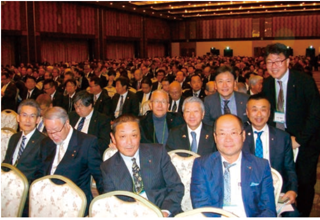
本会議開場を待つ皆様