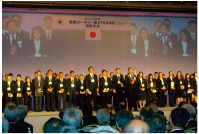
米山記念奨学委員会 報告