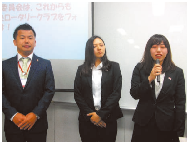
挨拶される市川会長