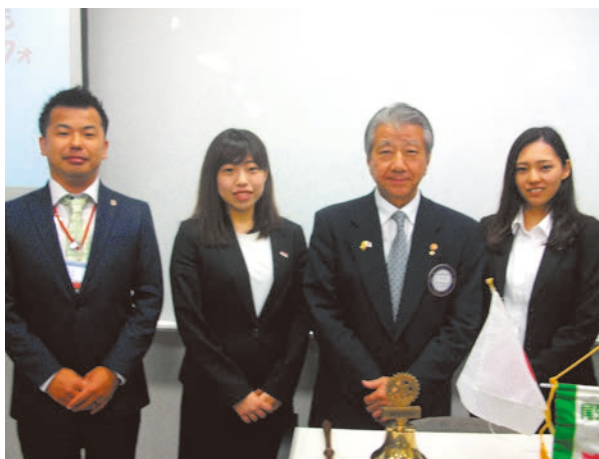
西村会長とローターアクト役員の皆さま