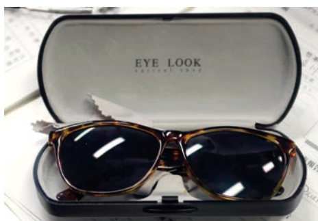
春の家族会 忘れ物のサングラス