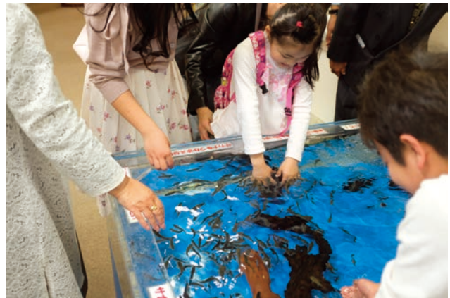
ドクターフィッシュ