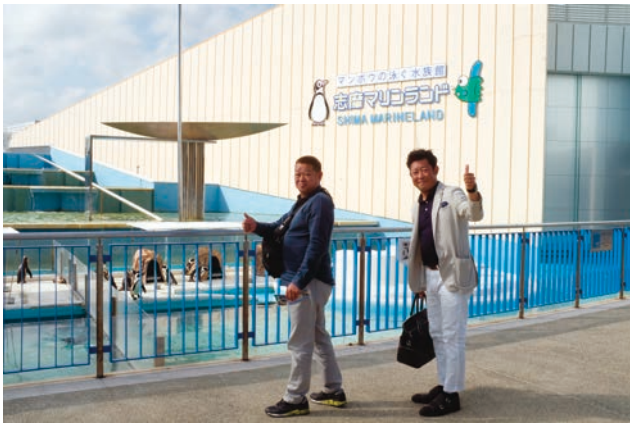
志摩マリナランド