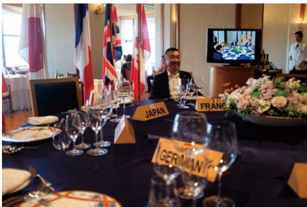
サミットテーブル