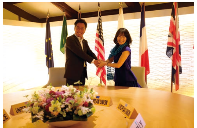
サミットワーキングランチで使用されたテーブル 固い絆で結ばれています！