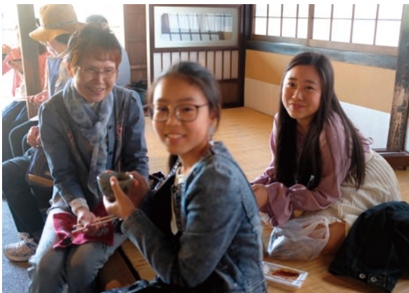
おかげ横丁 赤福本店