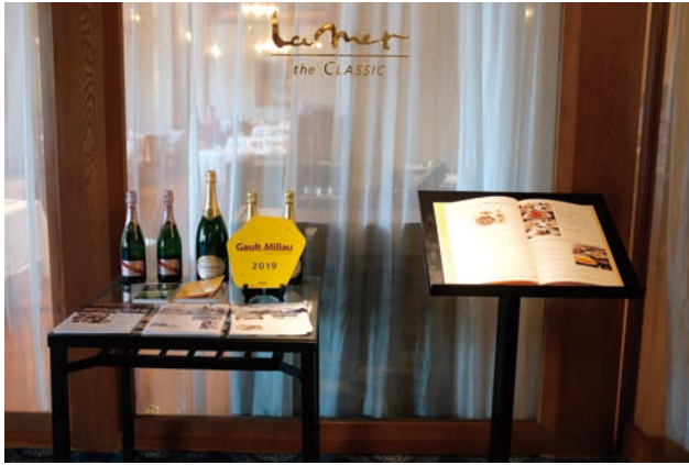
昼食会場 フランス料理「ラ・メール」