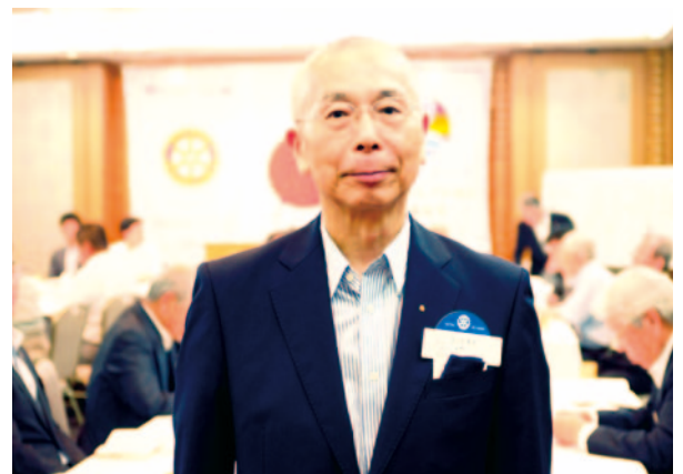
ゲスト 犬山RC松平様