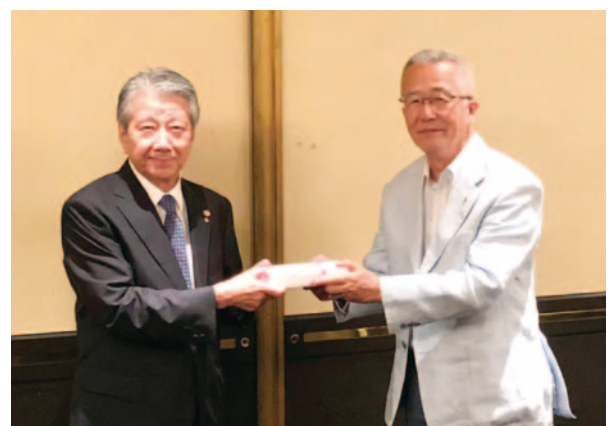
感謝の集い 大野パスト会長よりお礼