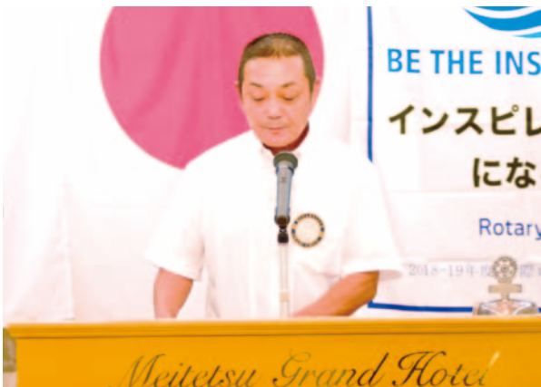
青少年奉仕委員会魚住委員長