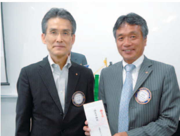
ご夫人お祝い 松岡君