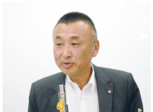
館君ご紹介者挨拶 堀尾君