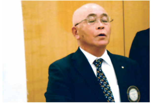
唱和 住川ソングリーダー