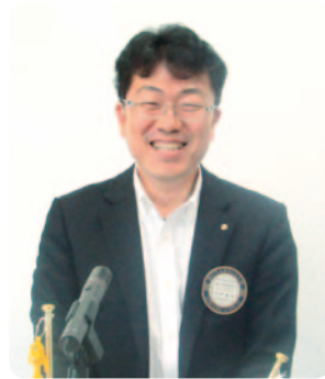
委員会報告 今村会報・雑誌広報委員長