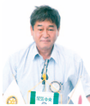
ニコボックス報告 太田(利)委員長 プログラム資料委員会 環境保全委員会