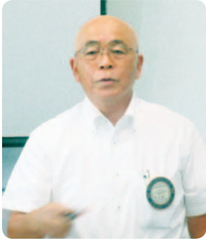
唱和 住川ソングリーダー