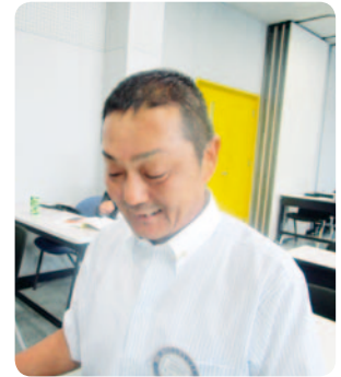
委員会報告 魚住会員増強委員長