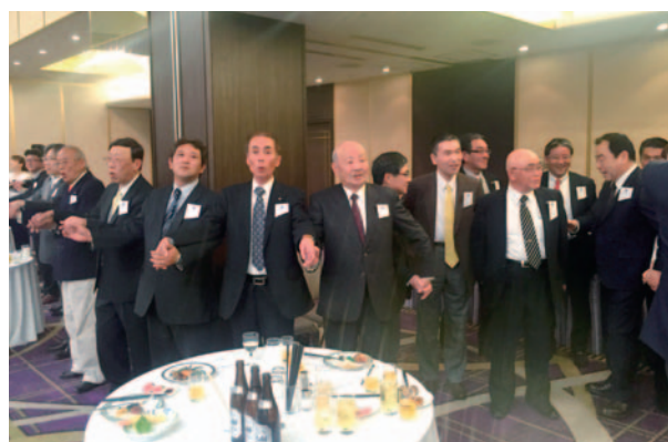
RCソング「手に手つないで」