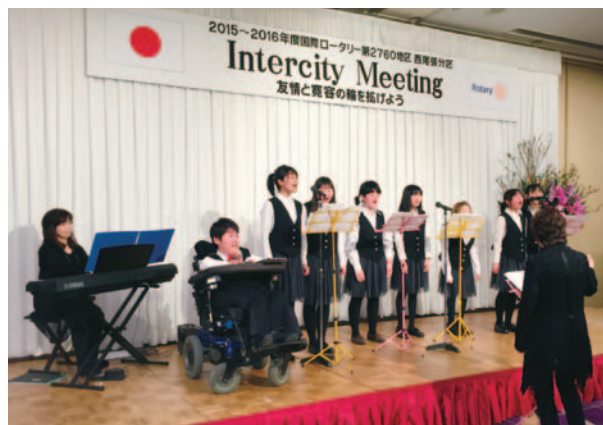
合唱団「キッズ・ラブリーマ」