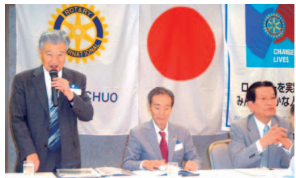
ガバナー補佐指導による クラブ・アッセンブリー