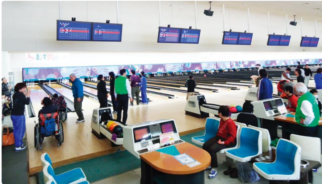
待ちに待ったボウリング大会！