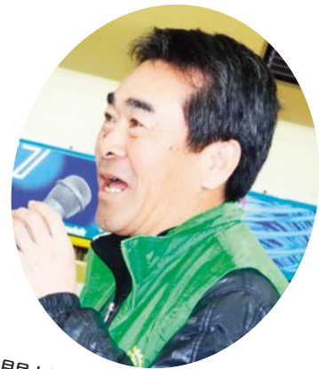
尾関社会奉仕委員長