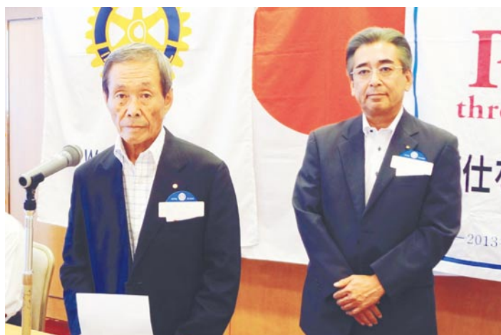
創立記念式典開催のご挨拶