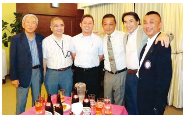
老いてよし、若くもよし ロータリー