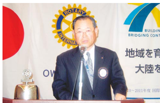
次年度役員・理事を発表する沖野会長エレクト