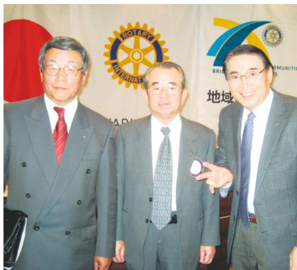
今月のお祝い 皆さまおめでとうございます