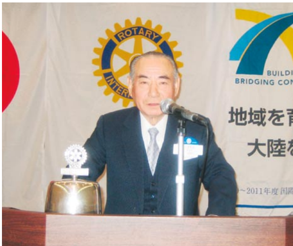
来期の抱負を語る松前憲典ガバナーエレクト