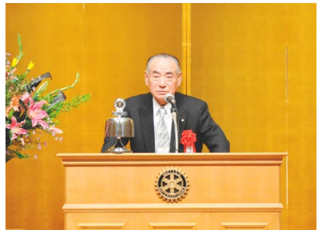
松前ガバナーエレクト