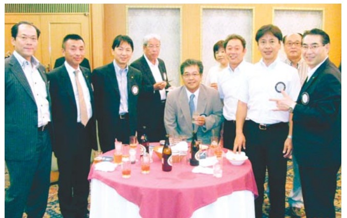
明日の古稀還暦ゴルフ 飛ばしや軍団(次期ニューリーダー)