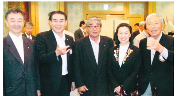
平野バスト会長、濱島バスト会長も帰国おめでとう!