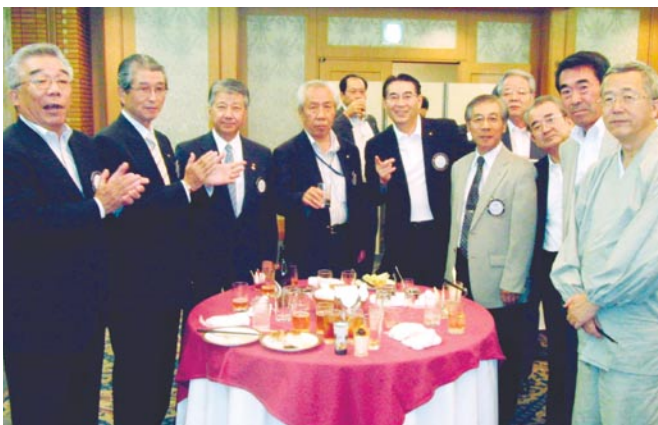
親睦と友情とゴルフで結ばれたかけがえのない仲間たち